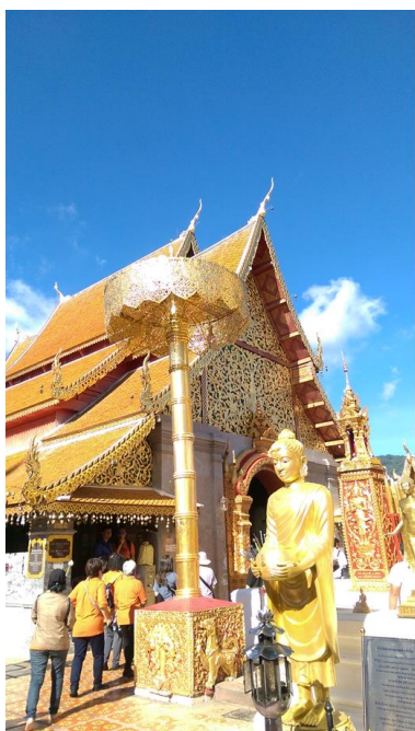
在清邁參觀的當地廟宇- 雙龍寺

泰國的水燈節是一個很大的節慶全國各地都會放水燈和天燈來慶祝，泰國人相信壞運會隨著施放天燈和水燈而離去，我們選擇到位於泰北的清邁來度過這個節慶，清邁的水燈節非常有名，每年也會吸引世界各地成千上萬個旅客，到了夜晚水燈和天燈同時施放的時候，這樣的景色真的非常漂亮天空中到處都是天燈閃亮的光芒而水面也會倒映著水燈的光芒。