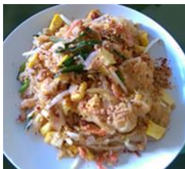
泰式 Pad Thai