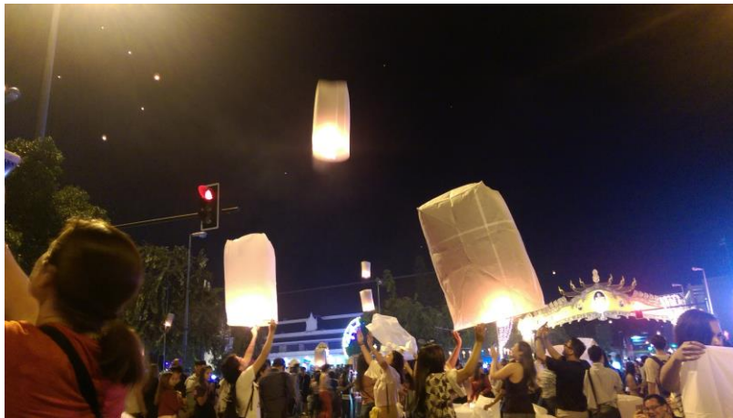
清邁度過的水燈節