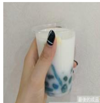
蝶豆花汁液做成的珍珠