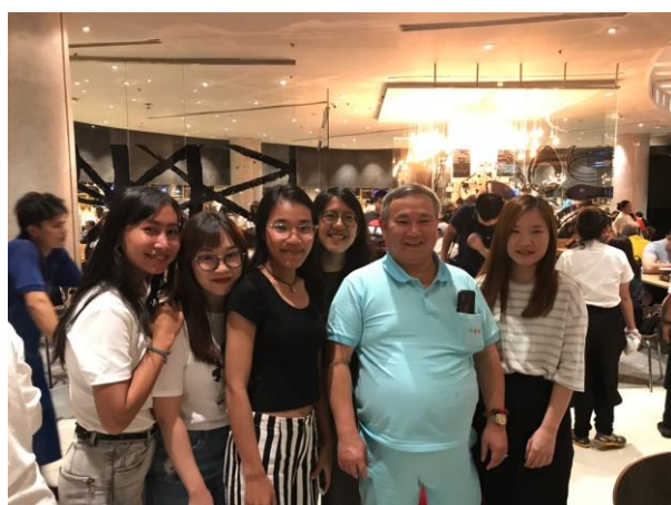
到 SIAM PARAGON 發放問卷