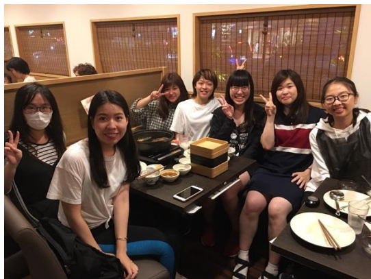
和日本的好朋友們與班上的好朋友們一起聚餐