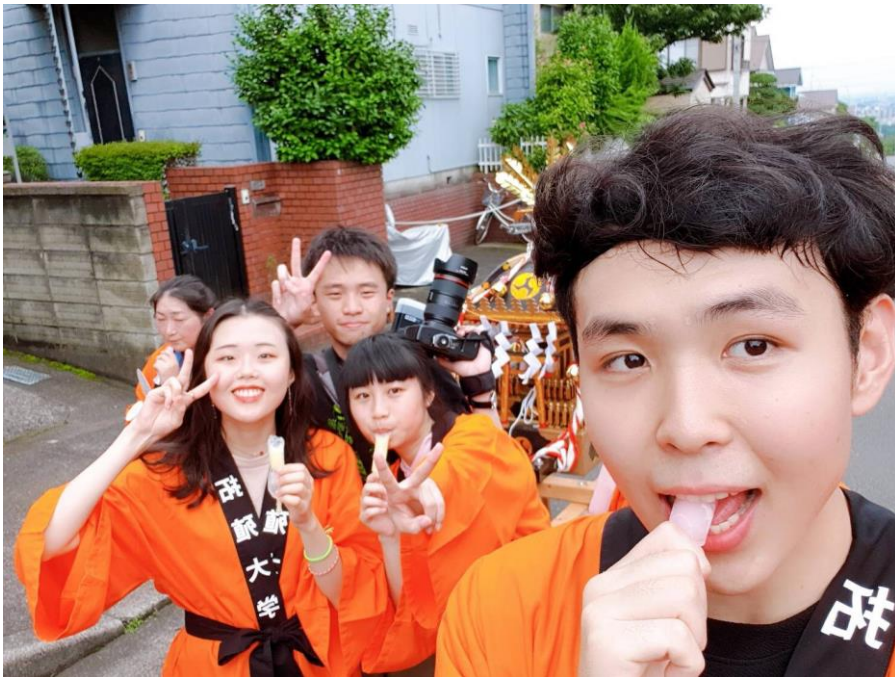
拓殖大學夏日祭典 抬神轎

出國留學，不管到哪，都不是件簡單的事，在下決定的那一刻，必須知道要抱有面對異境以及處理突發狀況的勇氣。或許一開始並不具有這些能力，但在面臨的那一刻，自己必須學會冷靜面對。所謂生命是一個過程，在這段過程中會運到許多選擇題。當你下定決心選擇的那一刻，就不要後悔，因為這是你為自己接下來的故事所做的開端，之後的情節都會因為這個開端而有所改變。來日本留學的這段過程，讓我真正體會了什麼叫做珍惜。也讓我了解到要放寬心，才能吸收到更多更美好的經驗與想法。每個人留學的理由不同，故事也不同，所以這段經驗顯得獨一無二。在未來的故事中，我要如何發揮這段過程中的遇到的角色和學習到的能力也是靠我自己的選擇。