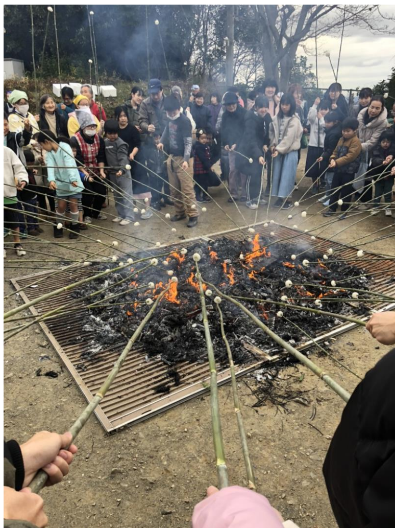
新年高尾社區的烤年糕活動