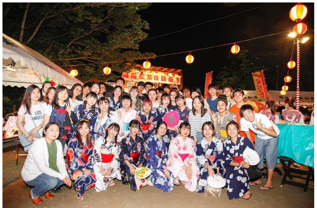
高尾社區 紅葉台祭典