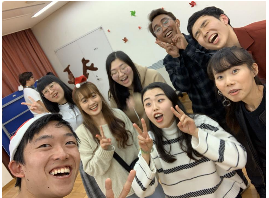
留學生宿舍歡送會

※心得報告內容大綱，請就以下主題分享，至少 5000 字及 6 張圖片(含說明)，12 號字： 備註：