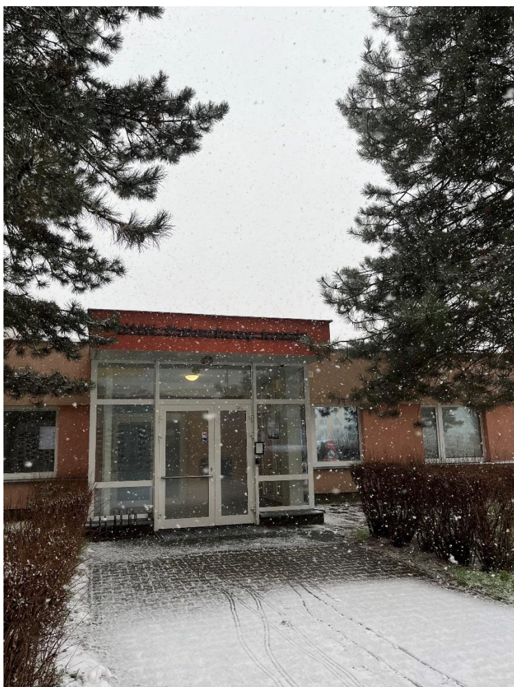
離開宿舍前拍的照片