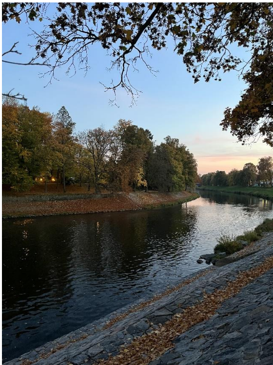
秋天時，學校公園的風景