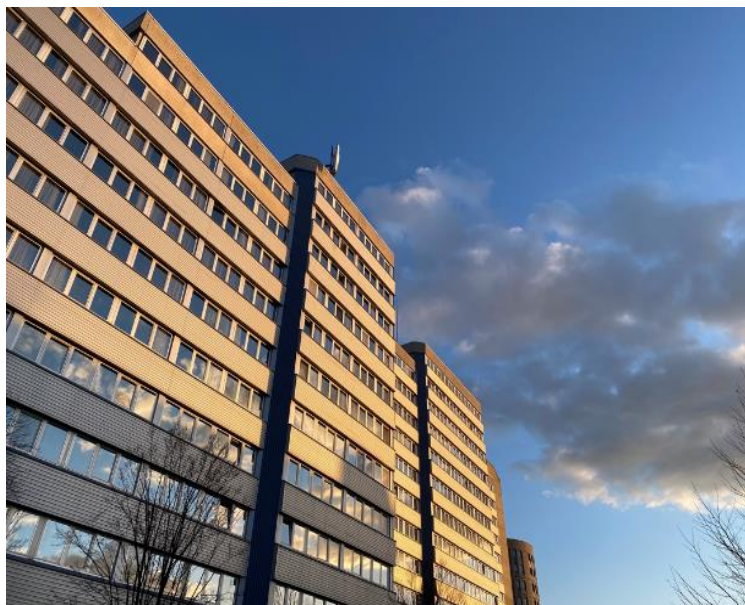
這間是我住了十個月的 Julius Raab Heim 學生宿舍

平常除了上課就是去超市買菜然後回家煮飯，短假日就約朋友去附近的湖走走或爬爬山，生活很悠哉。長假的話就計畫個長旅行。住宿、交通和飲食在下方費用篇會提到。