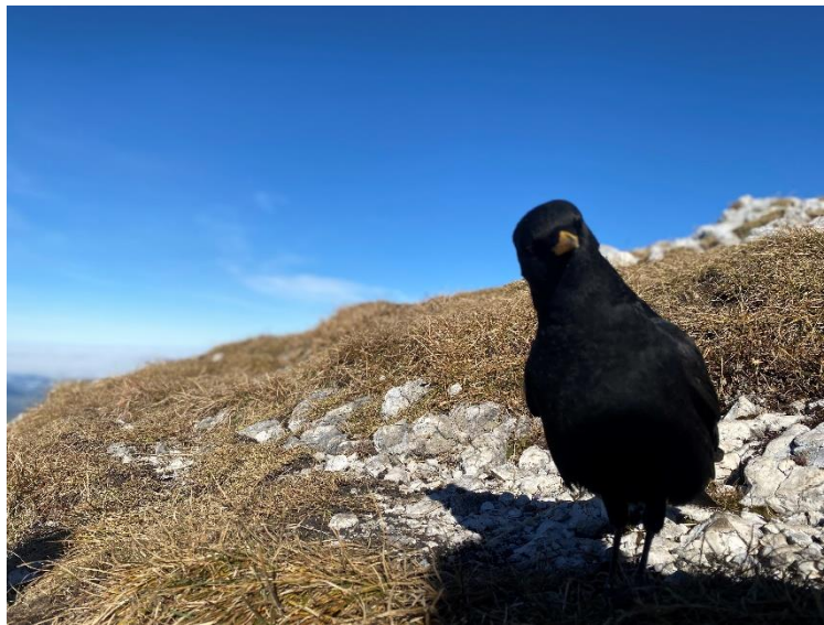
和朋友們去爬山 + 好奇鏡頭的黑鳥