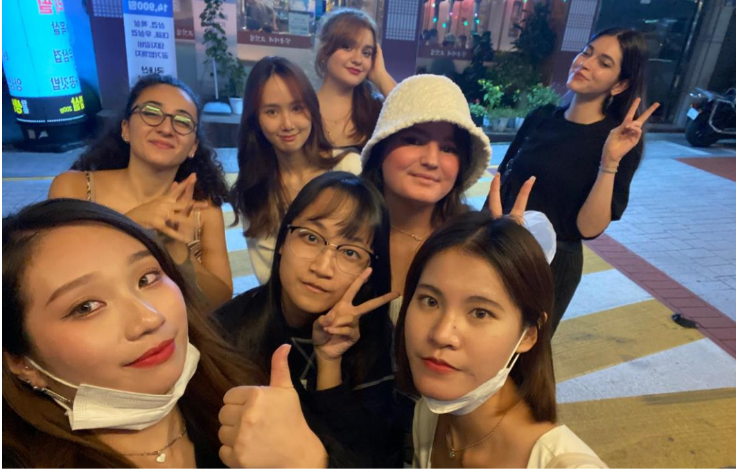
上圖為一起出門吃飯交流的朋友們

在學期剛開始時我參加了他們的迎新活動，我們玩了遊戲、聊了天、互相自我介紹、互相留了聯絡方式。真的很感謝他們有辦這個活動，在學期的一開始就讓我們認識了各國的朋友。此外還有辦在校內由各國交換生所籌備的文化分享會、辦在校外的闖關遊戲、在咖啡廳的交流會，還有諸如此類的活動，可惜因為時間問題沒辦法一一參與。