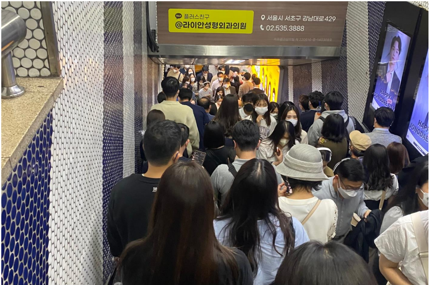
上圖為通勤時段的地鐵站