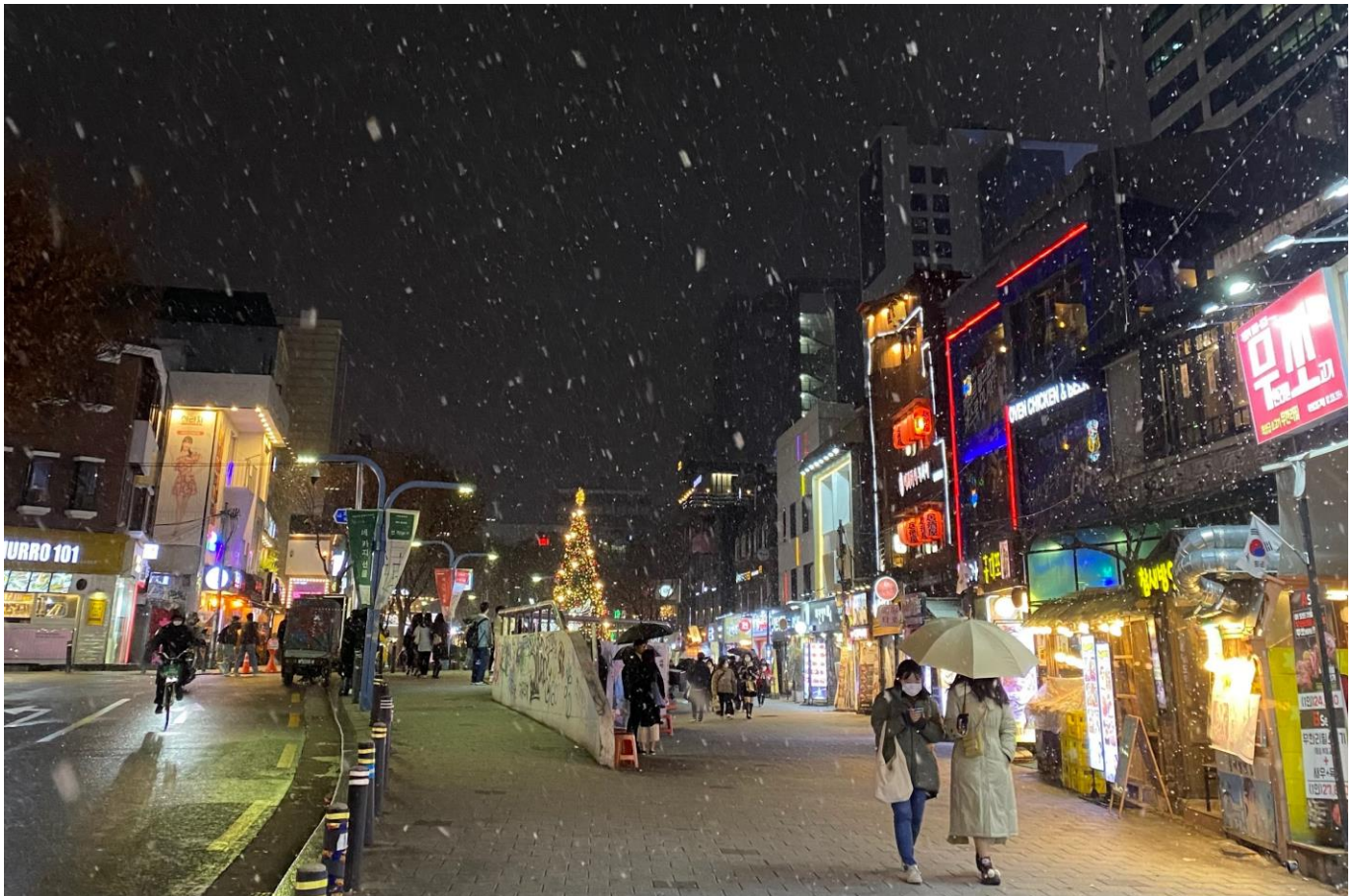
上圖為下雪的弘大街頭

最後，韓國的冬天真的很冷，2022 年冬天最低溫是零下負 17 度，是到了戶外一分鐘手就會凍傷的程度，所以延續上面資金的問題，保暖衣物也是一個龐大的負擔。但值得慶幸的是每當瑣氣冷到不行，雪就是最好的小確幸。