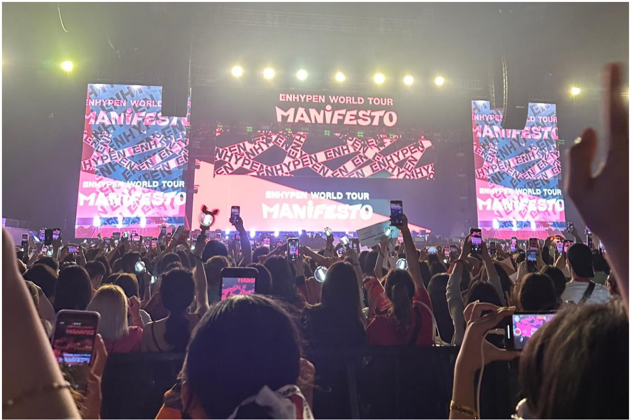
上圖為參加演唱會的照片

再來也一定要體驗的就是韓國的夜生活。韓國人的社交能力真的很厲害，從晚上八點的晚餐，再到十點的宵夜續攤，再從十二點持續到凌晨五點在夜店和酒吧的狂歡時段。一整個晚上都在喝酒，隔天早上還能畫完全妝來上課，真的很佩服他們的精力。我也在夜生活的社交中結交了許多朋友，有韓國朋友，也有來自世界各地各國的朋友。