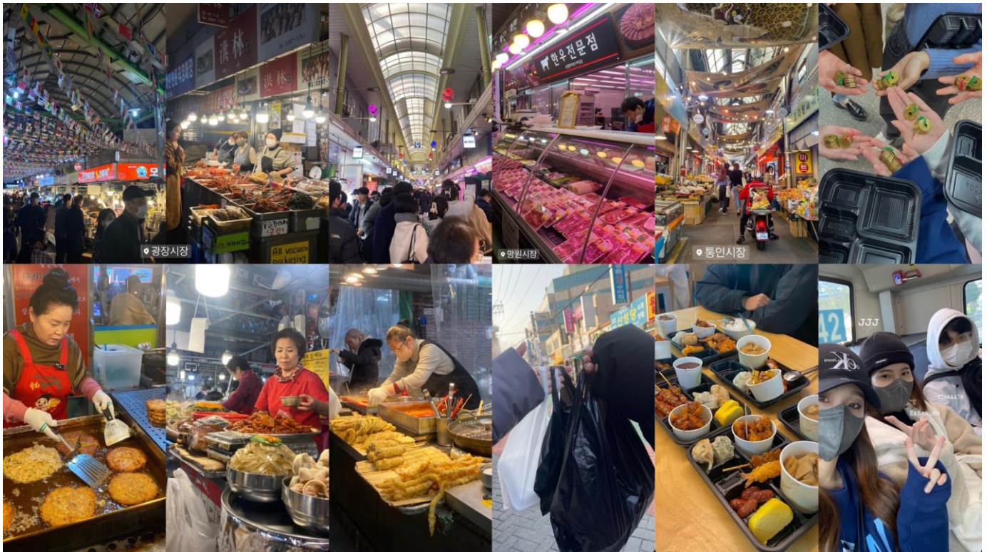
上圖為韓國當地傳統市場 (從左至右分別是廣藏市場、望遠市場、通仁市場)

再來也一定要體驗的就是韓國的夜生活。韓國人的社交能力真的很厲害，從晚上八點的晚餐，再到十點的宵夜續攤，再從十二點持續到凌晨五點在夜店和酒吧的狂歡時段。一整個晚上都在喝酒，隔天早上還能畫完全妝來上課，真的很佩服他們的精力。我也在夜生活的社交中結交了許多朋友，有韓國朋友，也有來自世界各地各國的朋友。