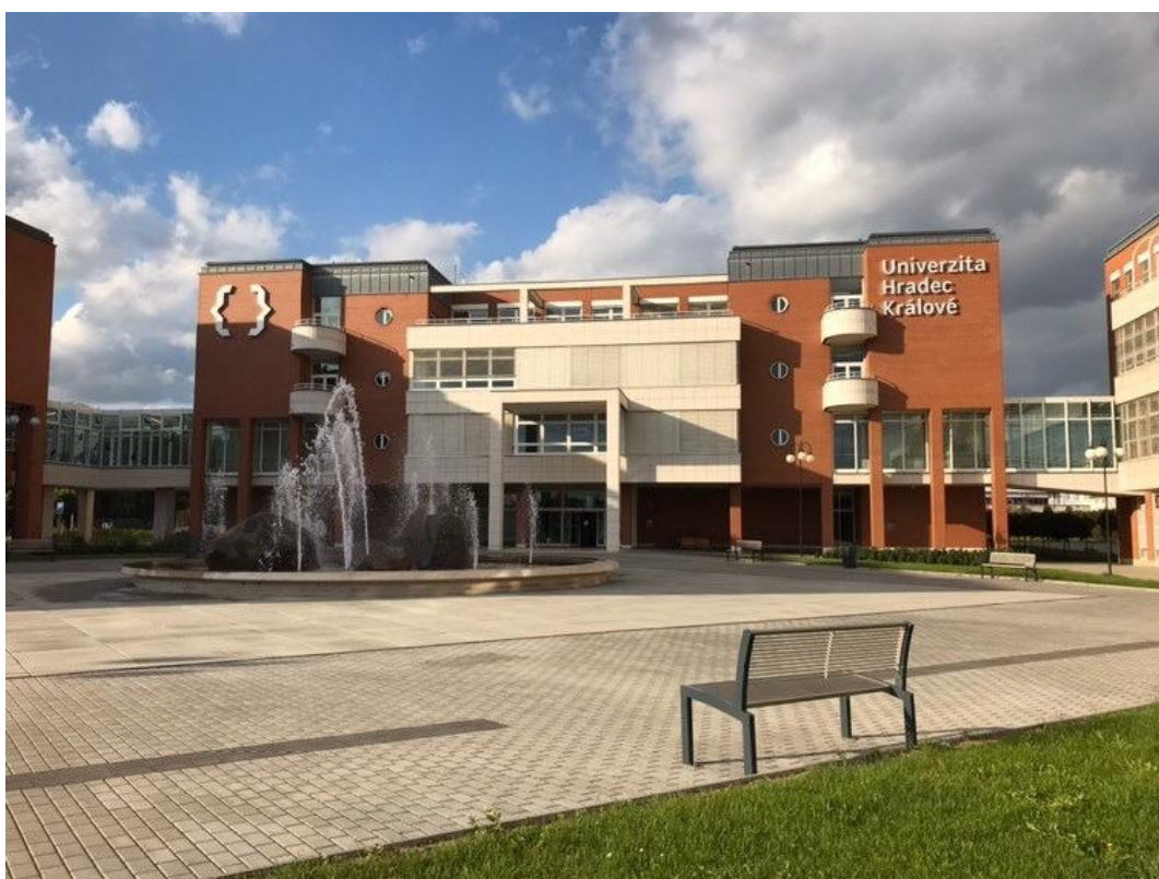
我都在這棟教學大樓上課

會租一台車，車會開往捷克的另一個小鎮，然後在那邊很像待4到5天，期間老師會教你如何 在雪上行走和滑雪，也有提供住的地方。下學期的體育課是到克羅埃西亞划船，學校一樣會 租車，然後開差不多14個小時到克羅埃西亞，其實車程真的滿久的，坐車真的做很久，回程 還因為車子出了一點問題，請另一輛來載，所以花了更久的時間，但是課程其餘的部分滿讚 的，老師會教你划船、浮潛，我們還有去克羅埃西亞的一個小鎮，還滿難得的，課程差不多 8天