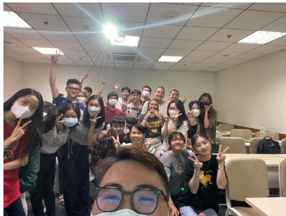
圖4: HRM 班上同學們

在學校，我被分到了國際班，我們班有不同的國家來到越南交換學生的，但大部分都是法國人，我是唯一一個亞洲人，當時我有跟我們班上的人交流，但我不得不承認法國人不太喜歡和陌生人一起玩，在我跟班上的負責人了解過後，法國人只和認識的人一起玩，而且通常都他們都是一組人去，所以我都有出去和越南朋友交流比較多。