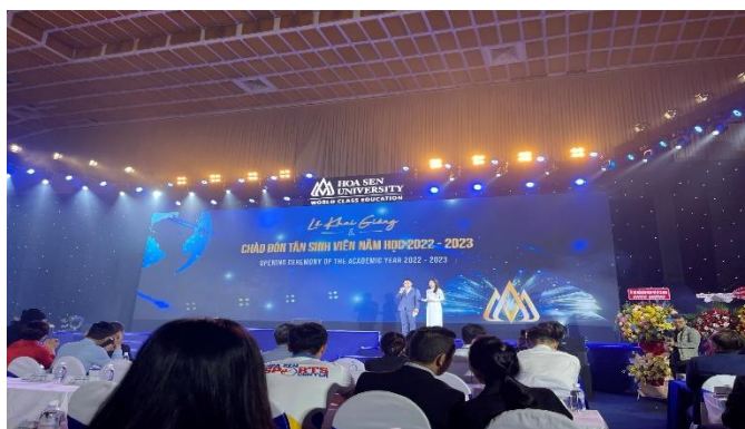
圖5: 蓮花大學開幕典禮

我在這所大學還蠻難過的，因為學校幾乎沒有辦活動給我們國際班，所以大部分時間我都專注於學習而不是參加課外活動，社團也是如此，我申請了柔道社團，但他們沒有回復，總的來說，我不喜歡他們為國際學生組織課外活動的方式。我在這所