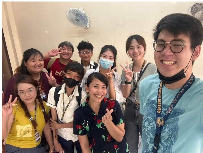
(課程結束大家合照)