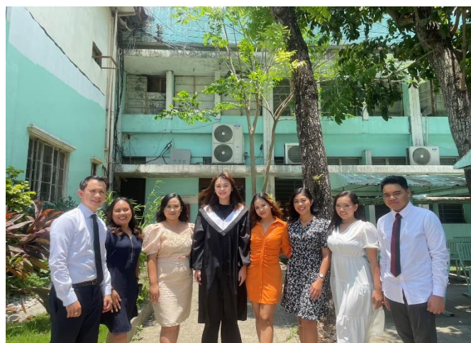
(大家穿上畢業服拍照留念)