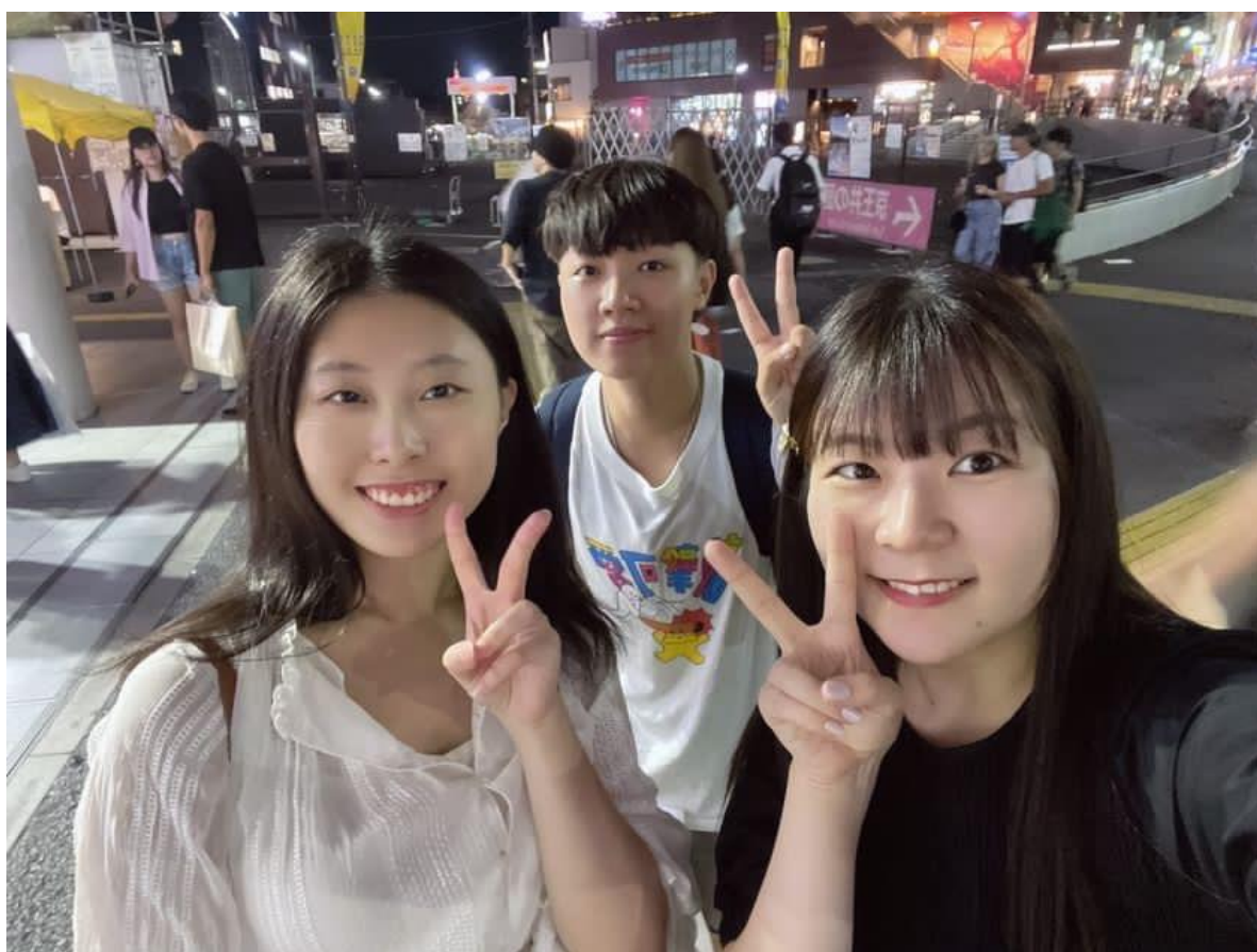
在日本認識的日本朋友