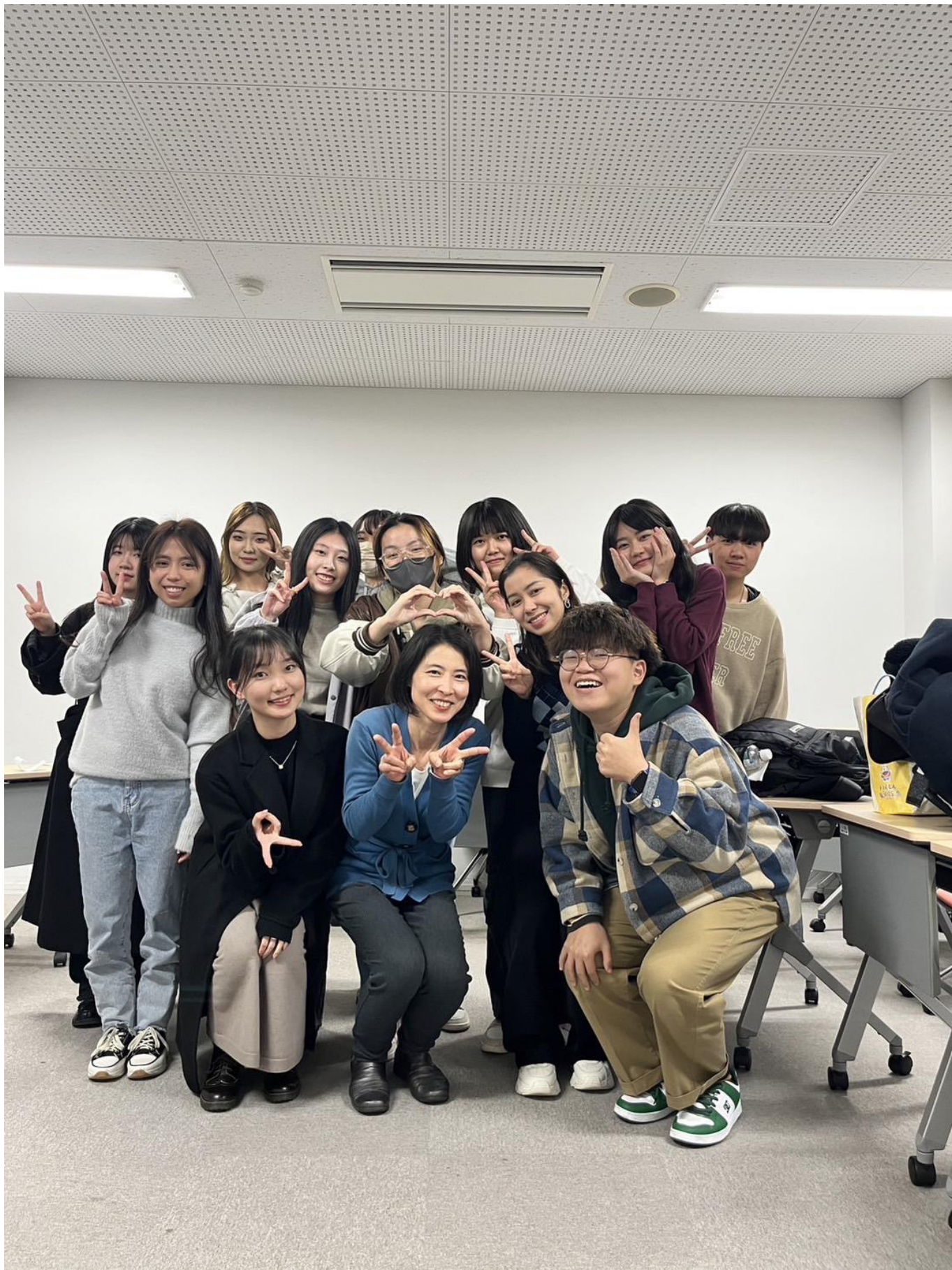
日本研究課程的班級合照