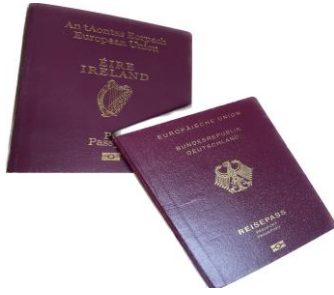
愛爾蘭室友的護照