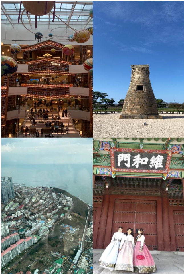
水源 慶州 釜山 首爾