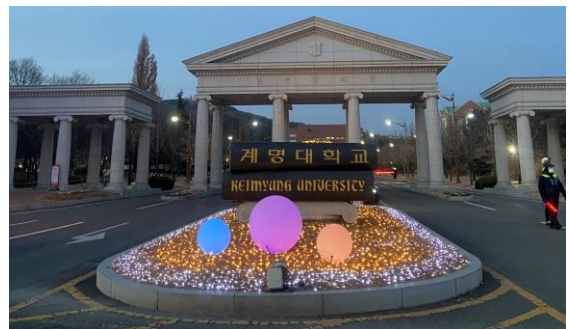
啟明大學校門口(聖誕點燈)

真的很開心又不後悔，一年前的決定，作為交換生到韓國，我來到大邱的啟明大學，是非常適合交換生的地方，看著我們宿舍有來自歐洲、美洲國家地區的人來交換體驗，就覺得不管奪遙遠的距離，大家都很有勇氣離鄉背井求學，就像我室友，我們都一樣，都想要突破自己，然後我們又很有緣份能在同間學校。在大邱說長不長，說短不短，看了人生中第一場雪，看到得瞬間，除了感動還是感動，如果當初沒踏上交換生旅程，就看不到眼前的下雪場景，韓國真的是一個可以體驗看看的國家，一年雖然無法走遍整個韓國，但光是到幾個都市，都能感受到韓國的城市與人情風味，下次我一定會再次光臨的。