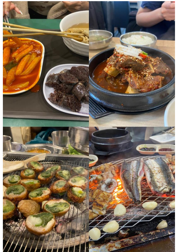
炒年糕血腸 燉排骨 小小烤腸 風川鰻魚