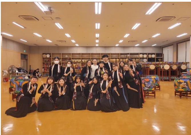
體驗韓國傳統打鼓服飾