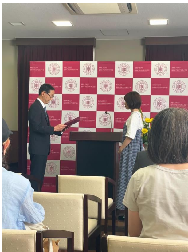
圖右:修了式證書授予