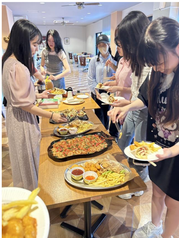
圖左:送別會朋友們與美食