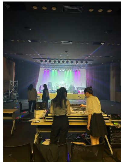
(在社團的演出與彩排照片)