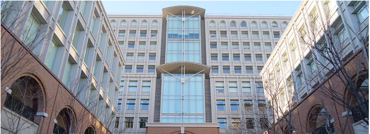
武藏野大學 有明校區

校園裡最常使用到的設施是圖書館和學生活動中心。有明校區以現代化的設計和數位化設備聞名，圖書館不僅有大量的書籍和資料，整體空間也寬敞明亮，營造出一種開放明亮的學習氛圍。另外，活動中心，是為了學生課外活動和休閒的場所，館內設有咖啡廳和餐廳，方便學生放鬆和用餐。