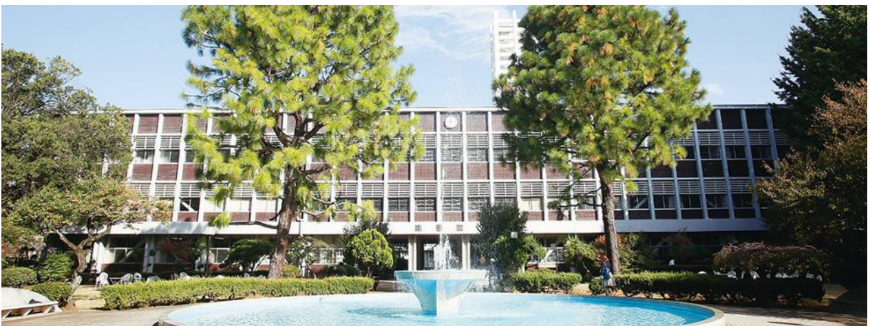
武藏野大學 武藏野校區