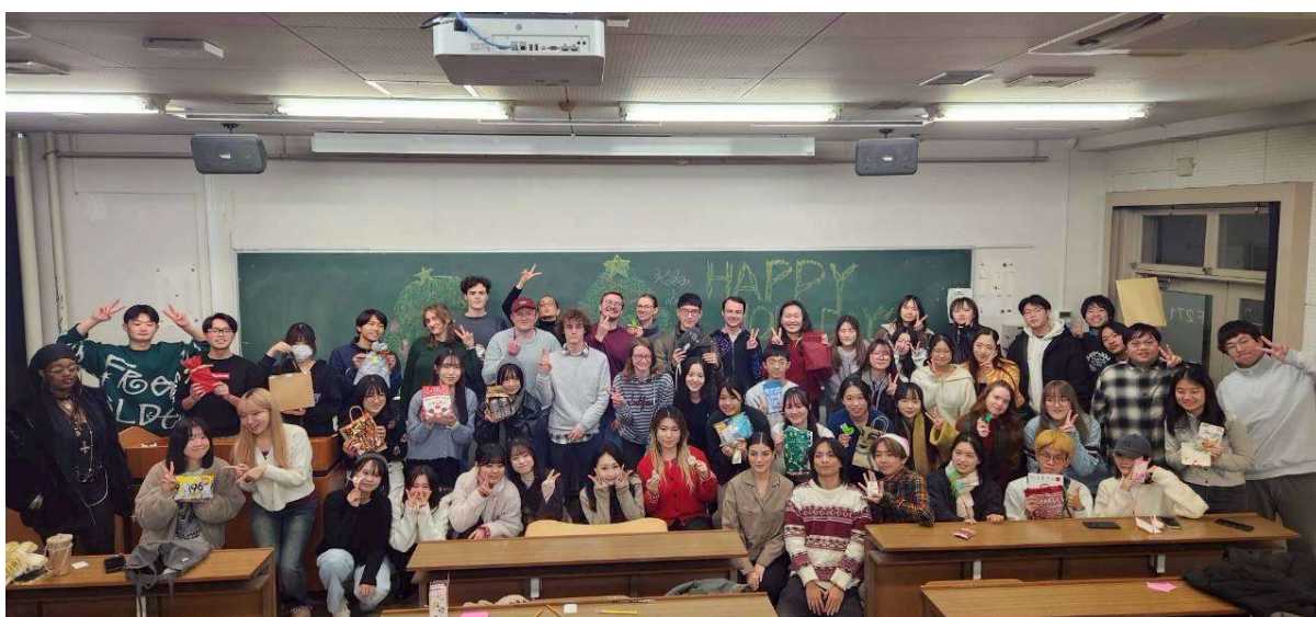
聖誕節派對當天大家一起交換禮物