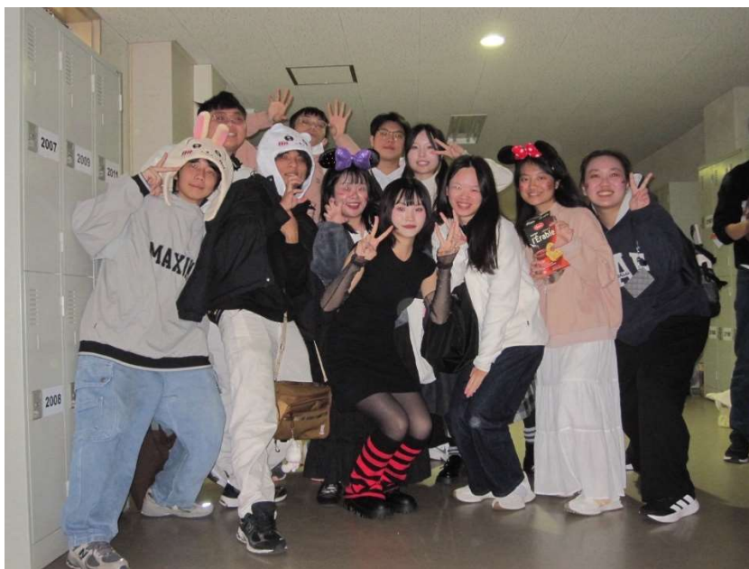
日本學生舉辦的國際交流活動的萬聖節派對

雖然我沒有參加校內定期舉辦的外語會話交流活動，但我身邊有朋友參加英文會話，口說能力明顯進步，也結交了許多歐美朋友。我認為這類活動對於想加強外語能力與拓展國際視野的學生相當值得推薦。透過課外交流、語言交換與寄宿家庭體驗，我在生活層面獲得許多寶貴經驗，也更深入理解不同文化背景下的思考方式，讓這段留學時光不僅止於課堂學習，而是全方位的成長與體驗。