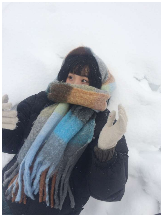
新潟降雪量豐富有很多滑雪場，其中以越後湯澤和上越妙高滑雪場聞名