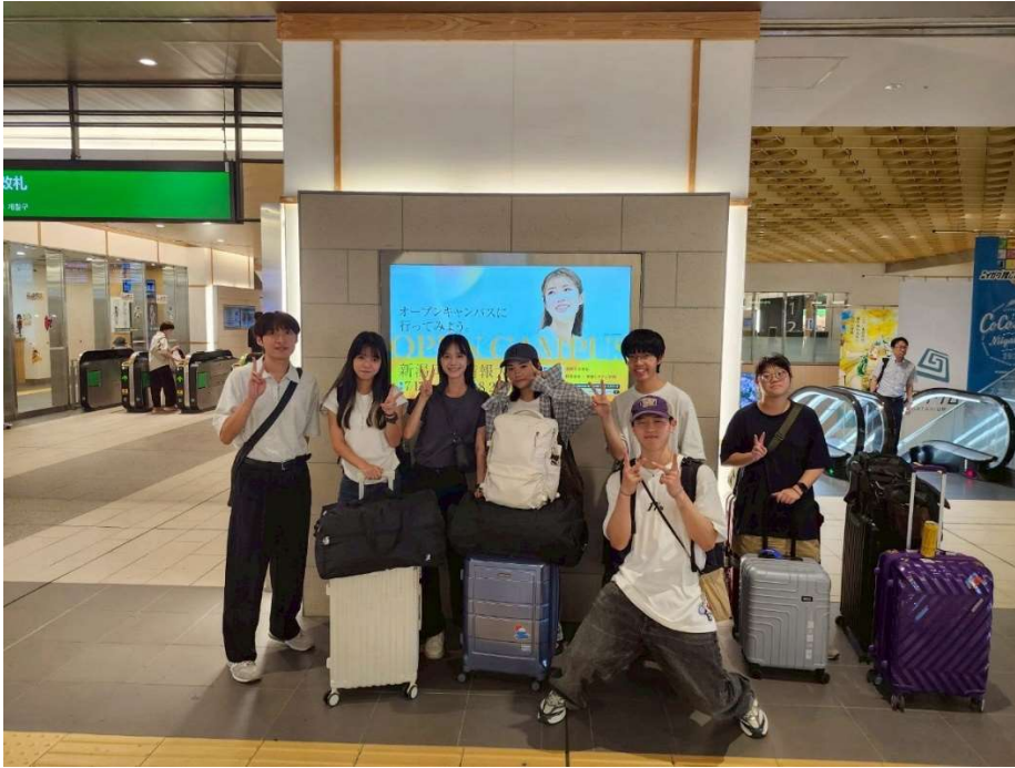
去車站送前半年一起相處的春季留學生離開，很不捨，大家感情都很好