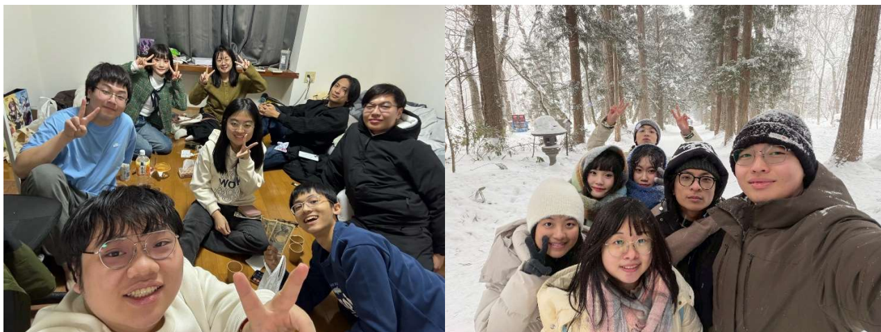
台灣留學生之間時常相約一同做飯，也會一同去外縣市遊玩

此之外，我也會到其他朋友留學或實習的城市拜訪他們，因此足跡遍及不少地方，留下許多珍貴回憶。