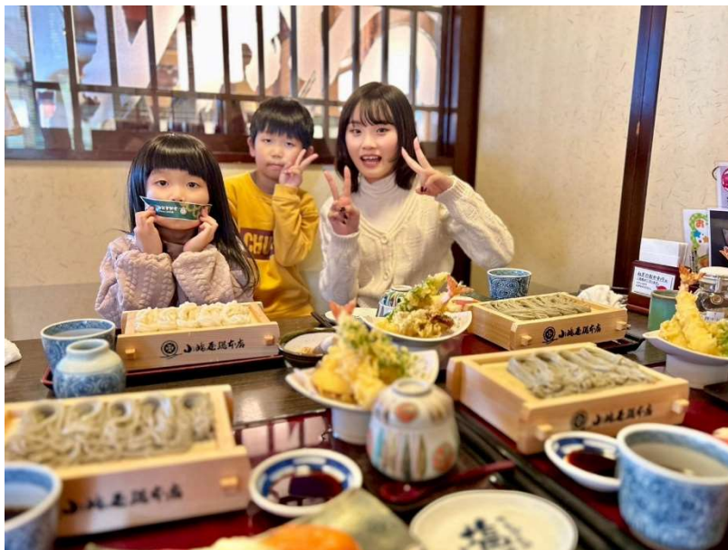
透過學校的活動和配對的寄宿家庭一起出遊聚餐