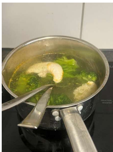
不會煮的時候就是水煮

原本在台灣我都是被照顧得好好的，想吃甚麼跟家人講就好，完全是一個不會下廚的人。可是一個人在外，外食我覺得不合我的口味，所以能解決問題的方法我只能自己煮了。幸好租的地方有附廚房以及相關廚具，從一開始甚麼都水煮或一些不用料理的東西到後面變成會自己煮義大利麵吃，我覺得這點我真的有肉眼可見的進步。