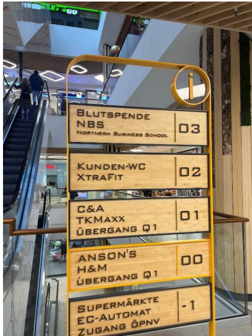
教室樓下的樓層說明牌

(IUCF)」，教授們每學期提供一次免費的創業諮詢時段，協助學生評估商業構想，並提供實務界專家的建議。