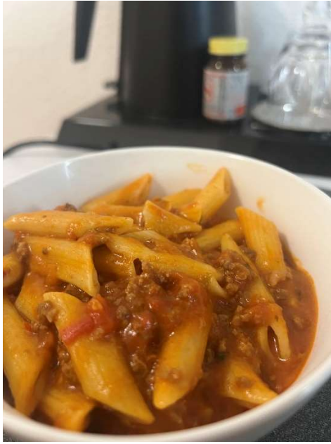
開始會做義大利麵了

後面還認識了住在隔壁的大哥，在他要出差的前兩晚他做牛排給我吃，也因為這次的機會讓我認識了很多我原本一定不會遇到的人，也了解了每個國家的人其實表面上看以來很兇但內心都蠻可愛的。