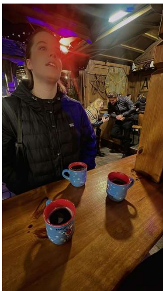
學校對面聖誕市集