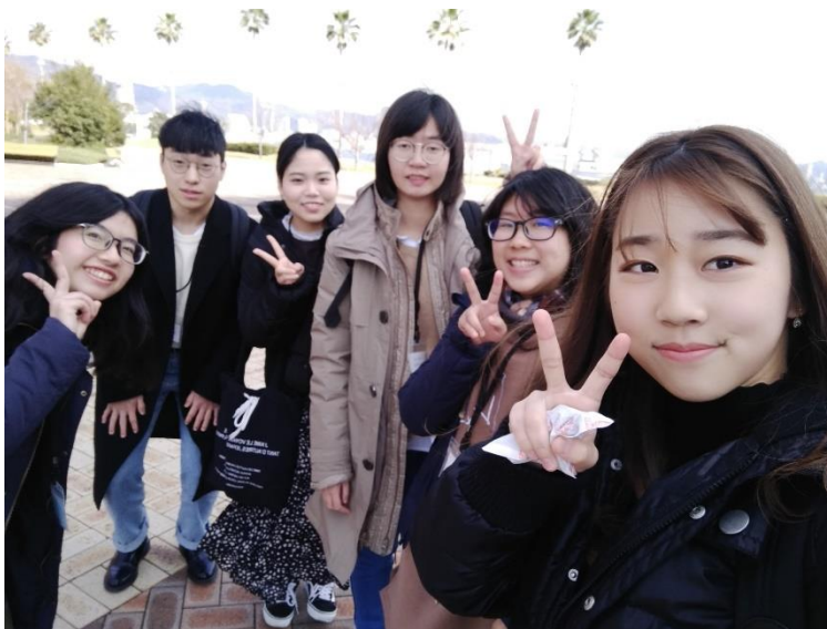
與日本、韓國學生交流

神戶學院大學位於兵庫縣的大學，靠近海港，與長榮大學締為姊妹校。在神戶學院大學研修期間，不只有長榮大學的學生，亦有韓國學生；而我們是由一群熱心的日本學生帶領我們，和我們一起上課、一起活動。