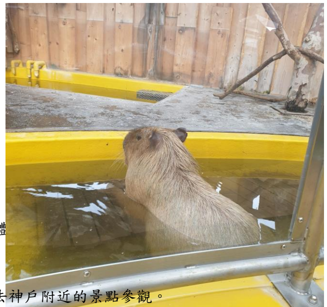
↑神戶學院學生帶我們去神戶附近的景點參觀。