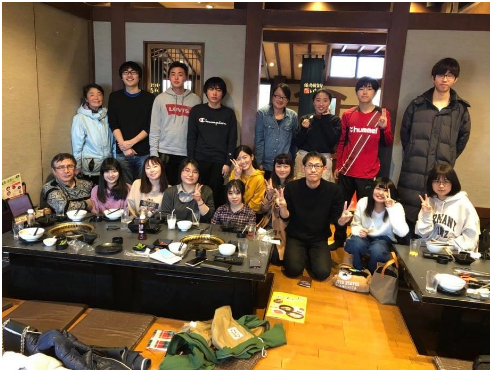
(讀書會的歡送聚餐)