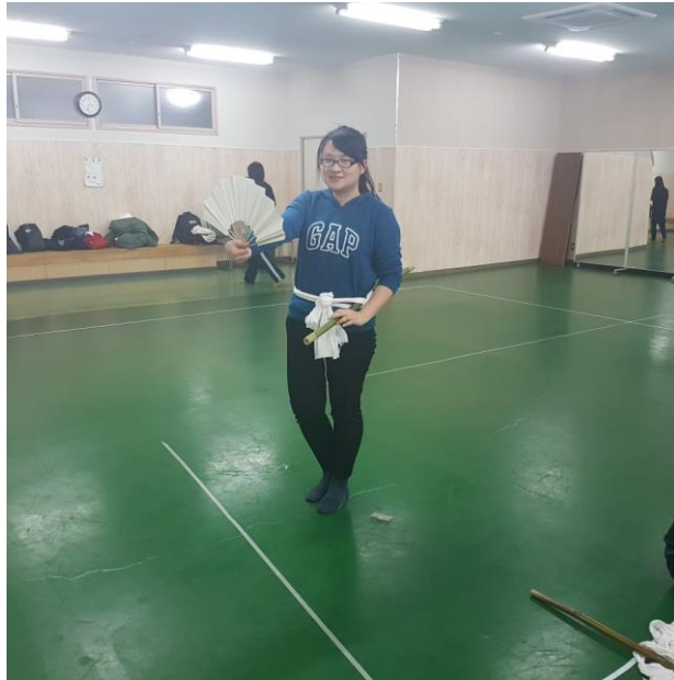
(日本舞基本裝扮:扇子、腰帶、竹劍)

再來是日本舞，這是長野大學開設的身體表演課程，除了日本舞之外，還有印度舞、火舞、和太鼓、喜劇…等多元課程，會選擇日本舞的原因是在台灣沒什麼機會接觸日本舞，所以覺得這是個很好的體驗，這學期老師教的舞是「岩崎鬼劍舞」，日本舞大部分都是為祭神而跳，一般人對於日本舞的印象可能都是女性穿著和服的優雅形象，但這支舞是男性舞蹈，動作雖不複雜，但有許多旋轉、跳躍的動作，舞蹈會配合日本佛經與和太鼓，時長約 15 分鐘，在這之中維持動作流暢性、與他人配合的默契、舞蹈全體的平衡，都很重要，所以期末能跟大家一起完整跳完真的很有成就感。