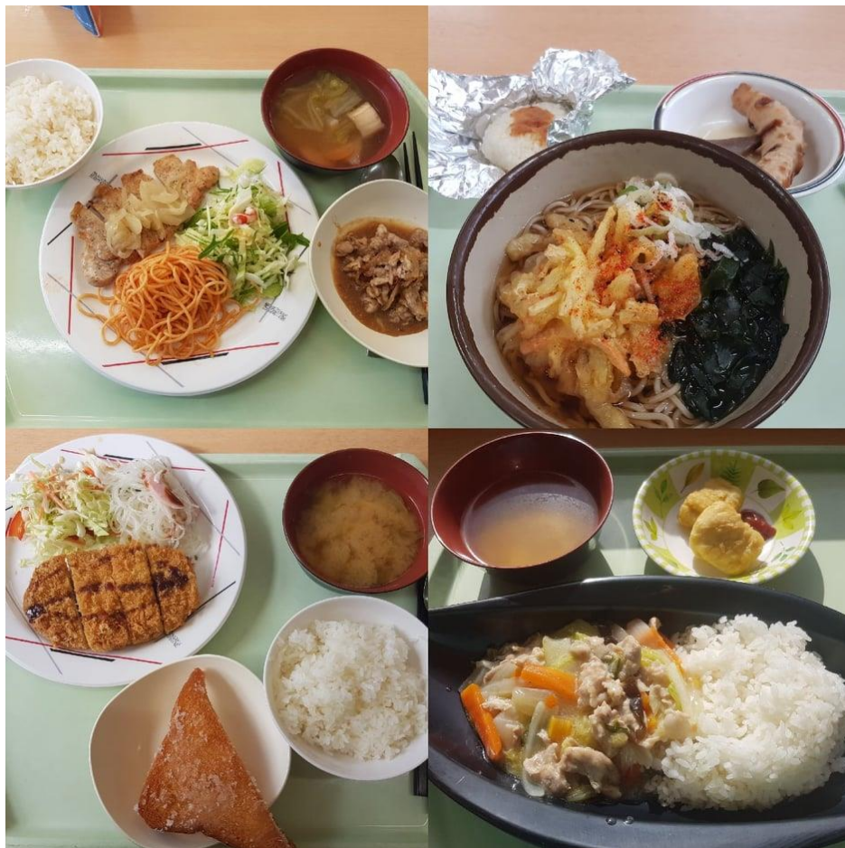
(大學食堂的午餐定食)

在日本的飲食可分為外食和自炊，自炊會至附近超市購買食材，超市都很便宜，種類也多，原本不會煮飯的我，在日本生活久了也會做不少料理；外食的部分，由於長野大學附近沒什麼餐廳，所以大部分都是去超商或學生餐廳，學生餐廳又分為食堂和喫茶店，食堂主要在午餐時段販售，每天會有 1 至 2 樣定食或蕎麥麵等等，每份日幣 390 元(買餐券會便宜大約 70 元)，今年剛好學校推出了期末考前的早餐定食，一份只要日幣 100 元，真的非常划算；而喫茶店則是有十幾種固定餐點，像是咖哩飯、蕎麥麵、拉麵等等，每份日幣 290 至 500 元不等，以日本物價而言算是很划算的價格，而且衛生又好吃，所以我通常都在學校吃午餐；而距離大學前 2 個站的寺下車站，以及上田車站周邊都有超市和餐廳，價格也都不貴，我偶爾也會到這些地方吃飯。