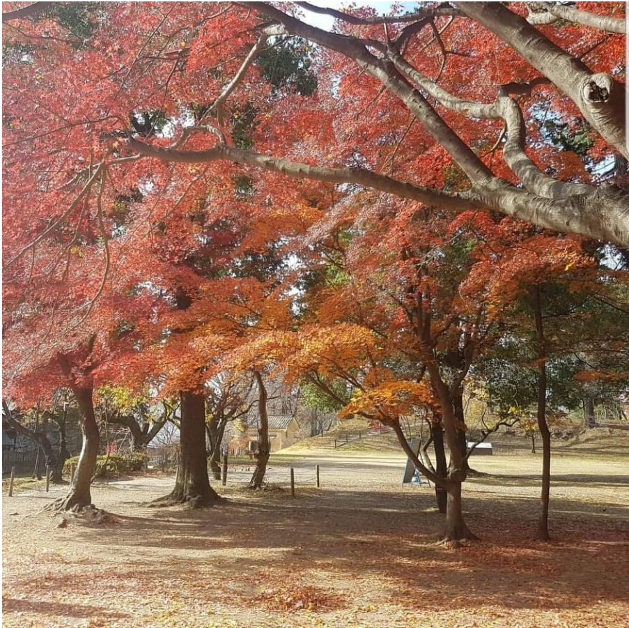
(上田城內的三色楓葉)

而長野大學比鄰上田女子短期大學，校內有三個學部，分別是社會福祉學部、環境旅遊學部、企業情報學部，每個學部底下也會有不同的分支課程，給學生很大的學習空間，我這次來交換的學部是社會福祉學部，底下便有社會福利、心理、精神保健、教育等分支，雖然跟長榮大學相比，算是規模較小的學校，但校內設備齊全，合作社、學生餐廳、體育館、各處室、大小教室、圖書館…等應有盡有，校地雖小，但環境很舒適。