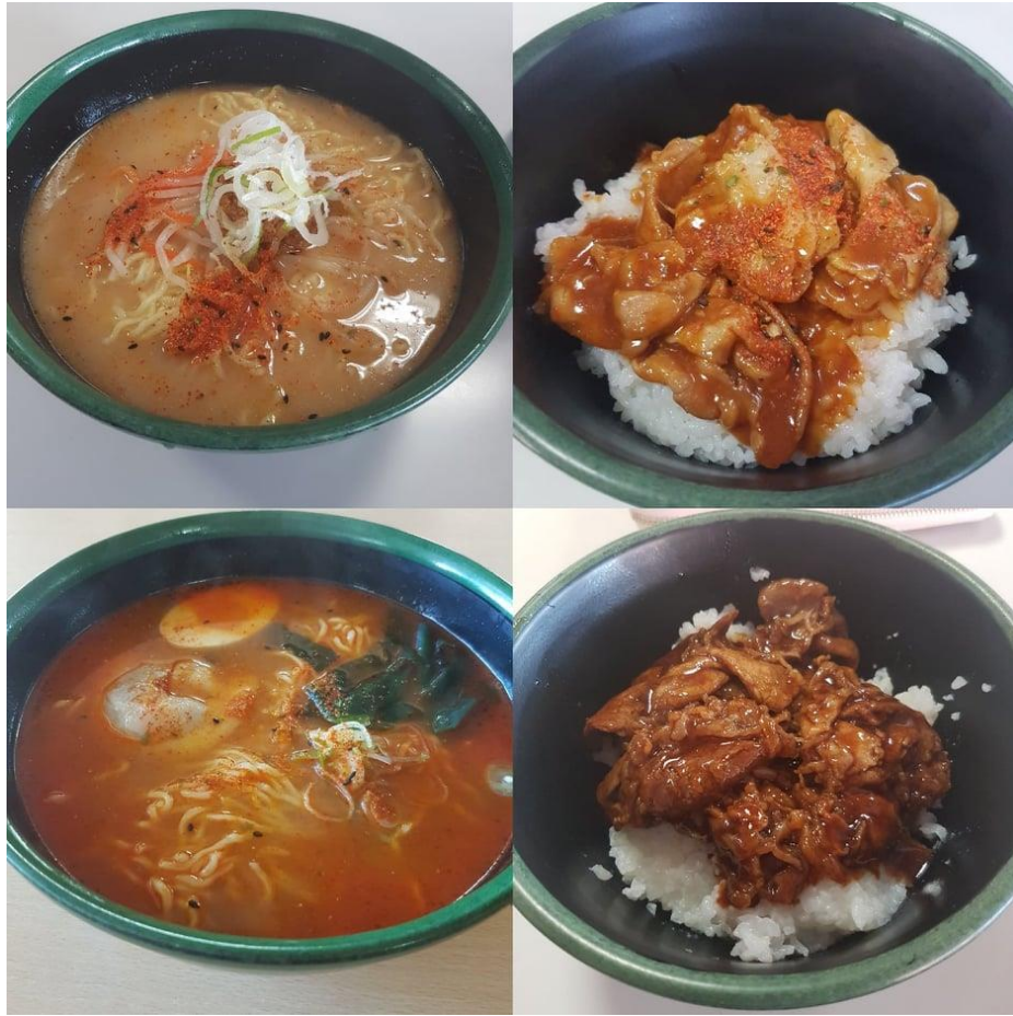
(大學喫茶店的餐點)