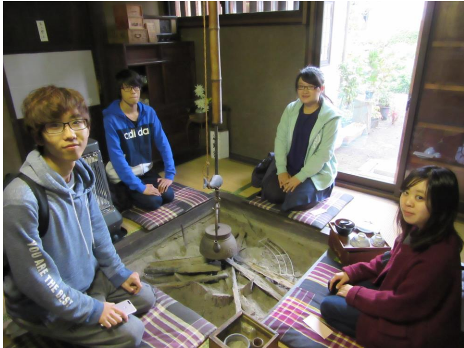
(跟中國交換生至海野宿體驗江戶生活)