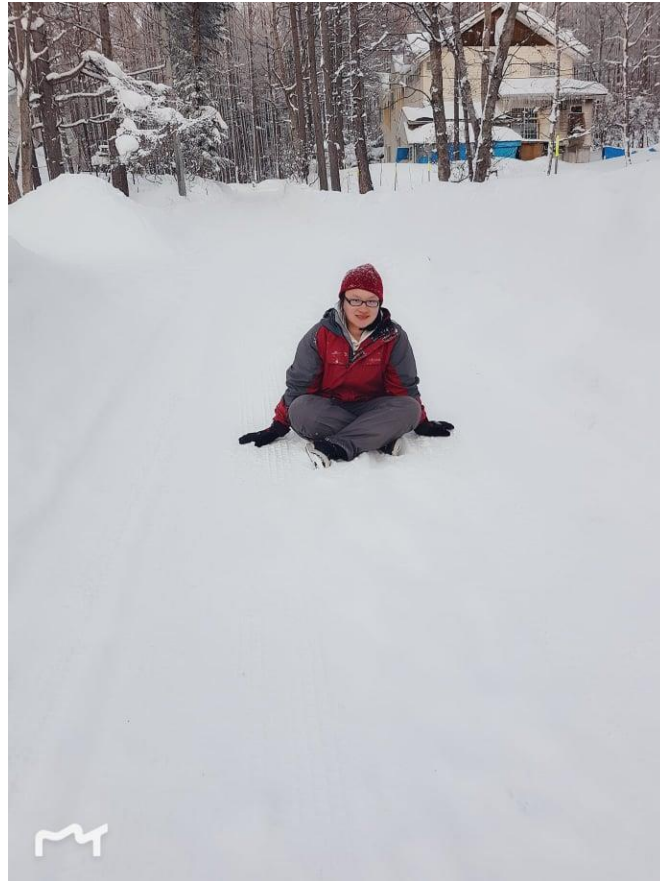
(在菅平高原的滑雪體驗)