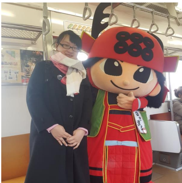
(在電車上巧遇上田市吉祥物)

長野大學是一所公立大學，位於長野縣上田市，上田市是長野縣內人口第三多的城市，上田市也是有名的真田之鄉，因此很多地方都能看到真田武士的身影，市內的真田神社位於上田城內，也是許多武士迷的必訪之地，更是秋天賞楓、春天賞櫻的知名景點。