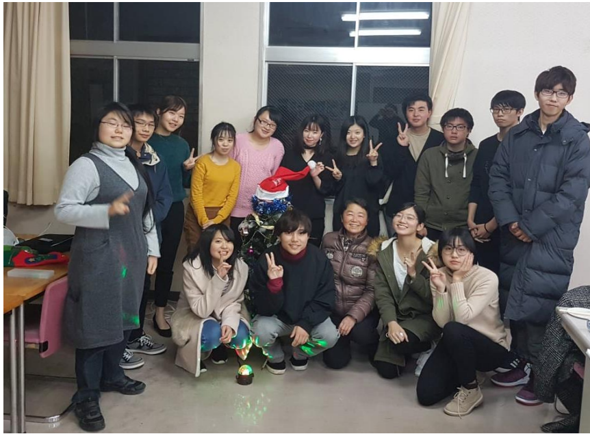
(讀書會的聖誕聚餐)