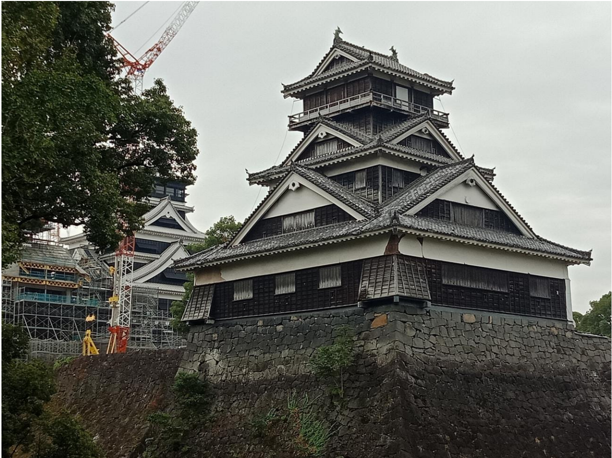
(熊本城 因正在修建中無法參觀內部)

接下來就是訂機票，因為對我來說這是第二次去日本想說路上有個伴也好互相照應，因此我是跟同樣去熊本大學留學的兩位同學一起從桃園機場搭飛機到九州福岡機場。原本日本學校方面是會有接機服務的，但因為飛機加上從福岡到熊本巴士花了相當多時間，到目的地通町筋的時候已經過了接機時間，因此我們是在通町筋的旅館入住了一個晚上，隔天才做學校安排的計程車到學校宿舍。