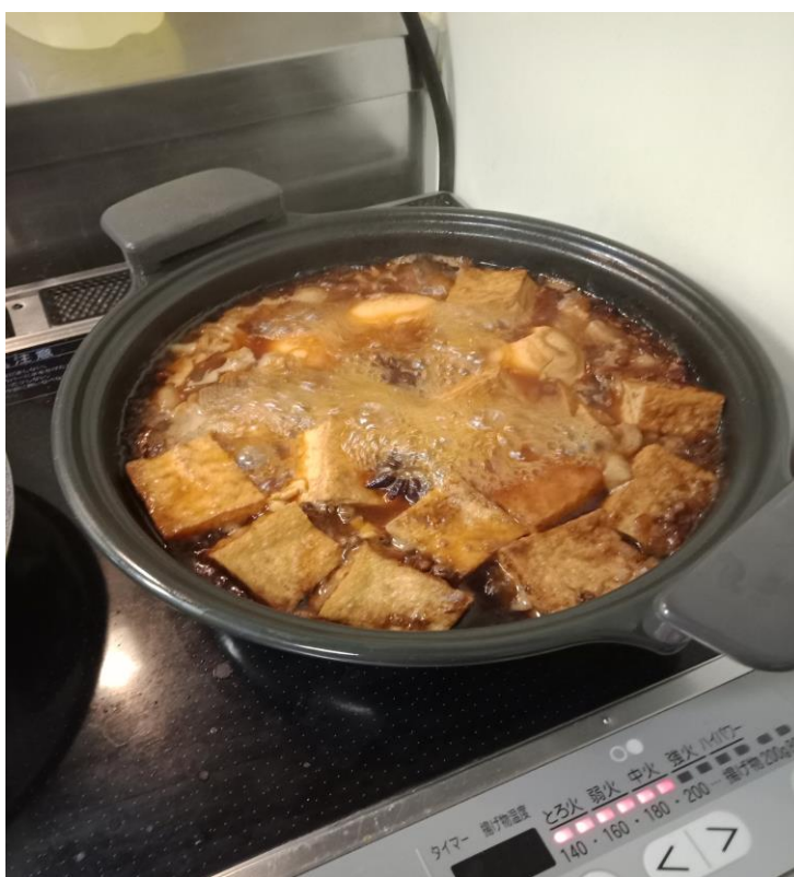
(跟室友一起煮的肉燥飯)

我的室友組成是一位台灣人、一位中國人、一位印尼人，剛入住的一個月，因為宿舍的公共空間除了廚房設備、洗衣機以外幾乎什麼都沒有，要自己煮飯或是希望泡些熱飲之類的人士勢必要去買熱水壺、鍋碗瓢盆之類的，這時就推薦跟同房的室友討論後一起出去買，住 4 人房最重要的是和室友溝通好一些公共空間的規定，例如週幾是誰倒垃圾，冰箱空間的使用等等，尤其是垃圾，日本跟台灣不同，對垃圾分類相當嚴格，沒有好好分類的話管理員是真的會跑來房間抱怨的，另外我有打算自己下廚，在買食材的時候也是跟室友分攤煮 4 人份，這種時候更要跟室友溝通好，不然發生金錢糾紛會很難收場。