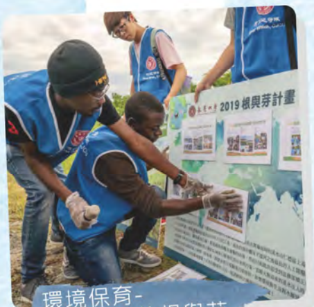
環境保育- 福爾摩沙的根與芽