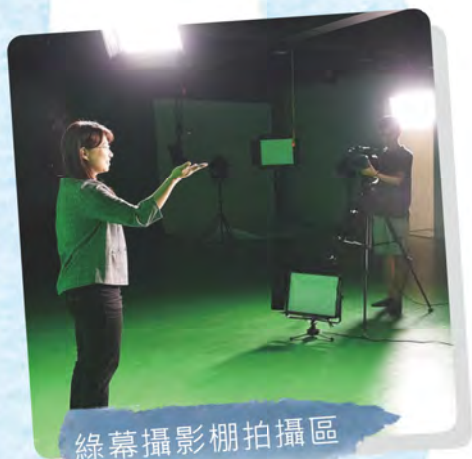
綠幕攝影棚拍攝區