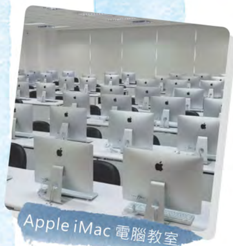
Apple iMac 電腦教室