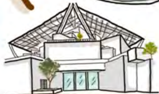
台南美術2館 Tainan Art Museum