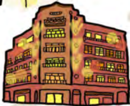
林百貨 Hayashi Department Store