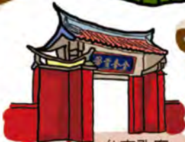
台南孔廟 Confucian Temple