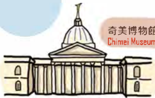
奇美博物館 Chimei Museum