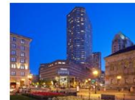
The Westin Copley Place, Boston