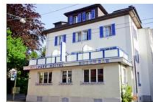
Bellpark Hostel GmbH, Lucerne