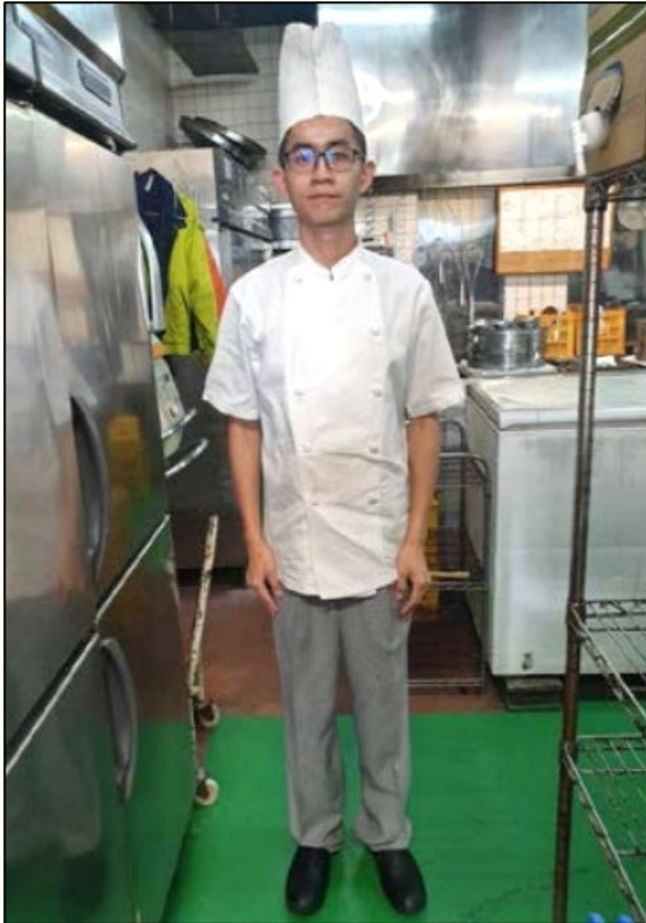
109年畢業系友 Kanucha Bay Resort