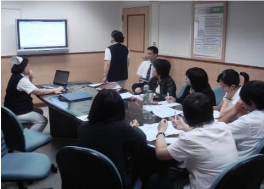
內容專家簡報訓練需求-1