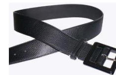
目立たないバックル色