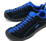
靴紐が黒ではない