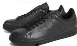
全体が黒色のスニーカー