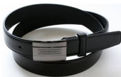
シンプルな皮ベルト