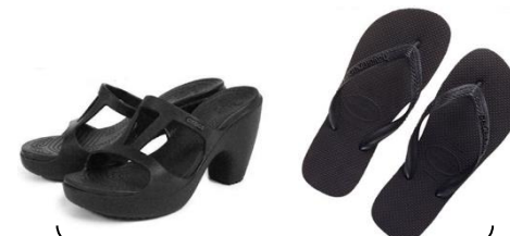
踵留めのないサンダル類