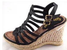
グラディエーターサンダル