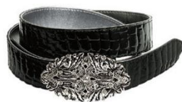
バックルが華美なもの