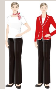
チケットカウンター