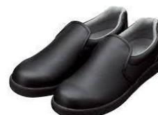
滑り止めのある靴