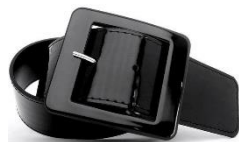
エナメル等光沢のあるもの