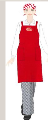
マイカップヌードルファクトリー