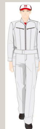
カップヌードルパーク