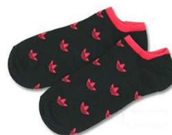
足首から上の地肌が見える