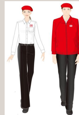
ミュージアムショップ