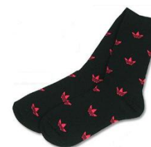
足首から上に柄がある