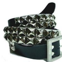
スタッズが入っているもの