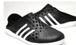
メーカー・ブランドロゴが分かる アウトソールが黒でない