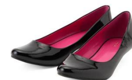
ベーシックなパンプス