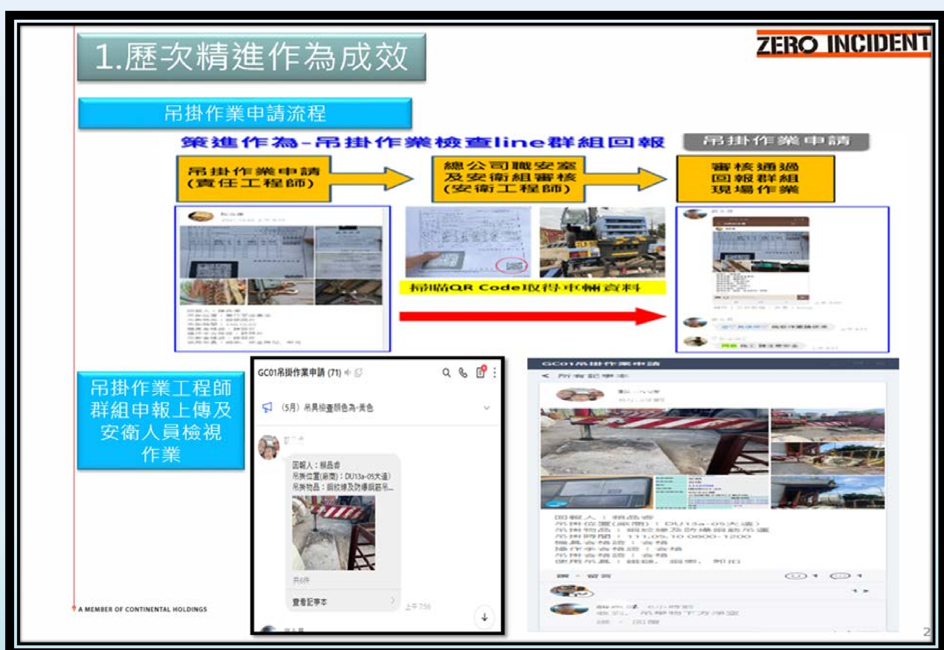
表: 吊掛作業工程師群組申報及安衛人員檢視作業