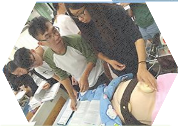
判讀無壓力測驗 (NST)結果