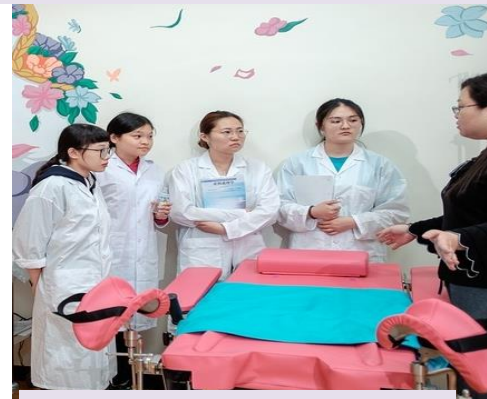
樂得兒產房模擬室