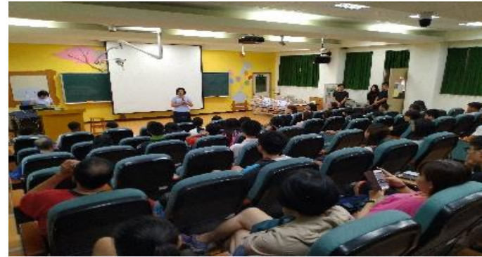
醫護資訊示範教室 (階梯式示範教室共112個座位)