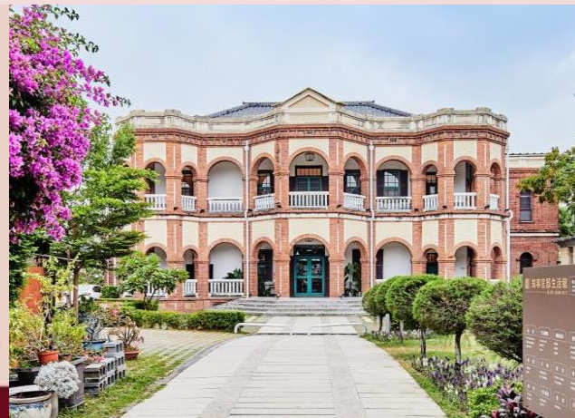
南台灣最好的私立大學