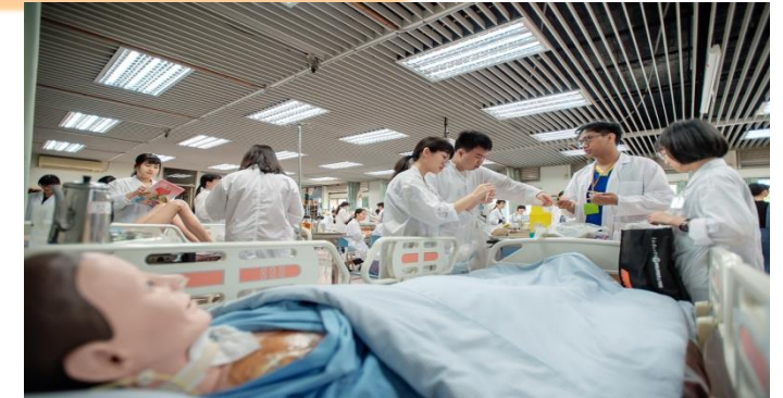
醫院模擬病房區 (設有9張病床, 1張智慧模擬病床 及智慧護理站)