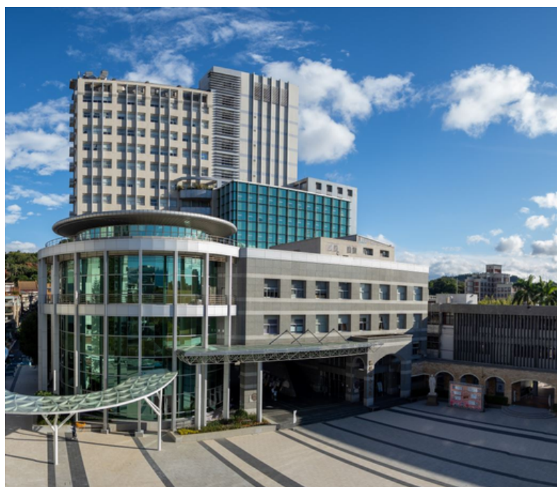
鏈結北醫大校院資源