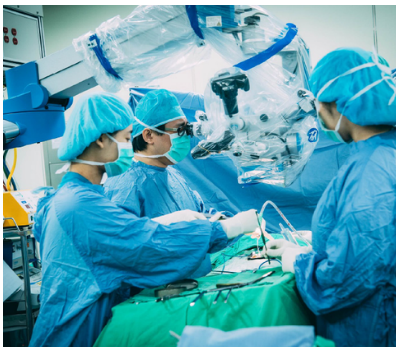
培養急重難罕照護能力