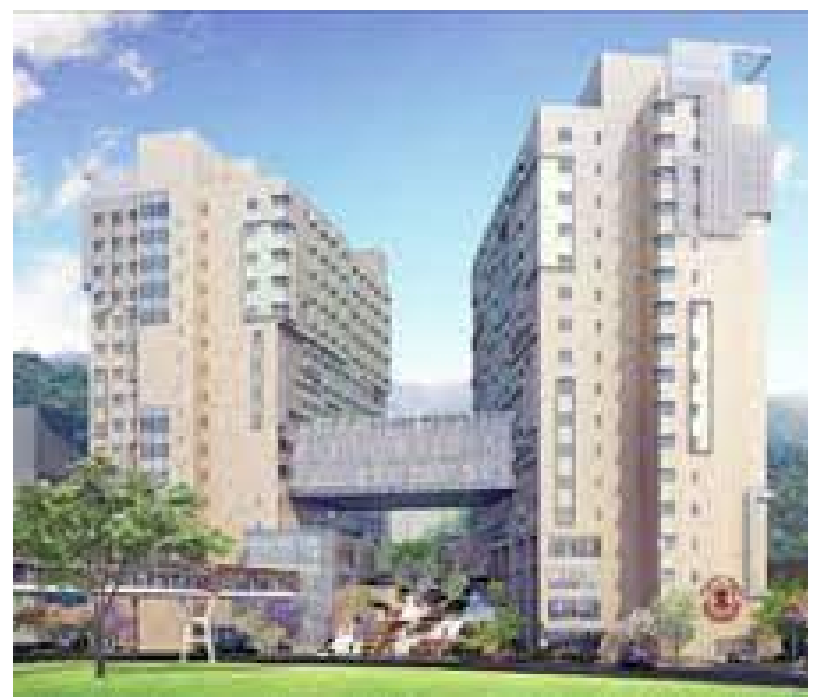
生醫園區培養創新人才