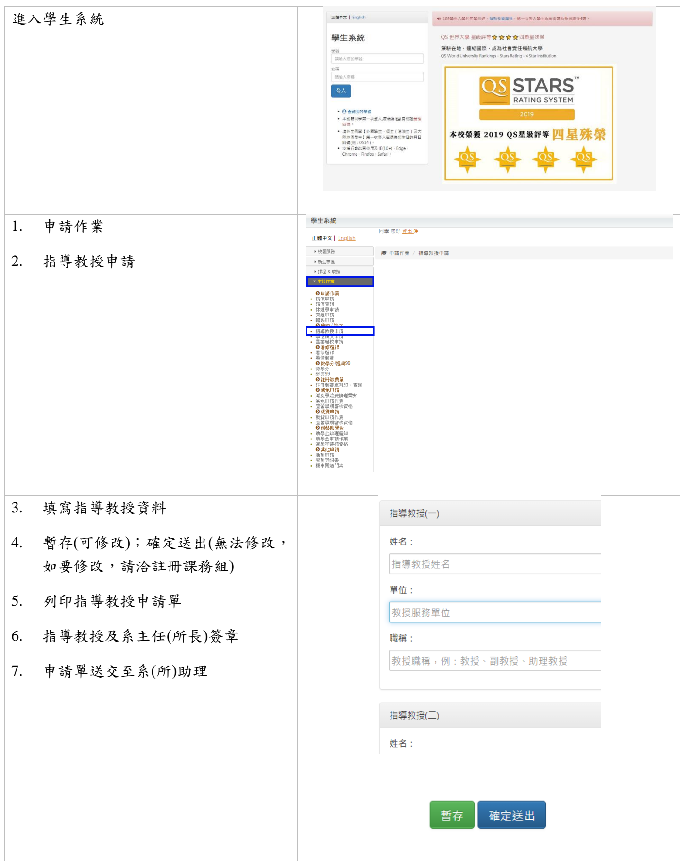
表 一： 長榮大學研究生碩士學位論文指導教授「學生系統」操作說明