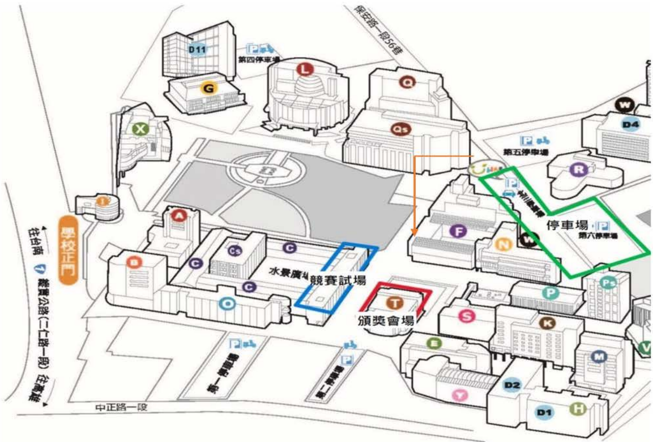
圖1、活動會場動線圖