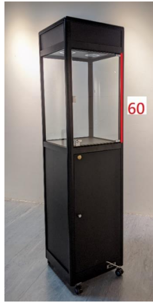
8、玻璃金屬展示櫃-黑 (180cm*45cm*45cm)