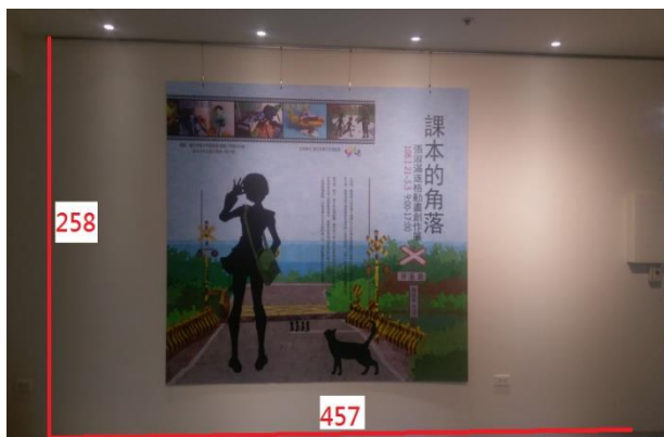
2、入口左側牆面軌道(258cm*457cm)