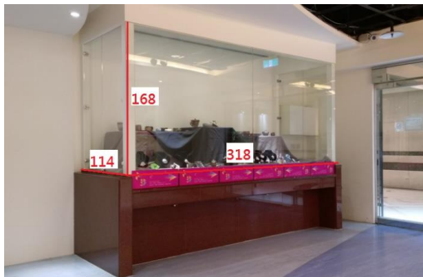
1、入口右側玻璃展示櫥窗 (168cm*318cm*114cm)