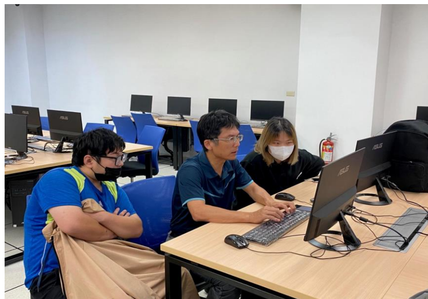
照片說明：講座情形