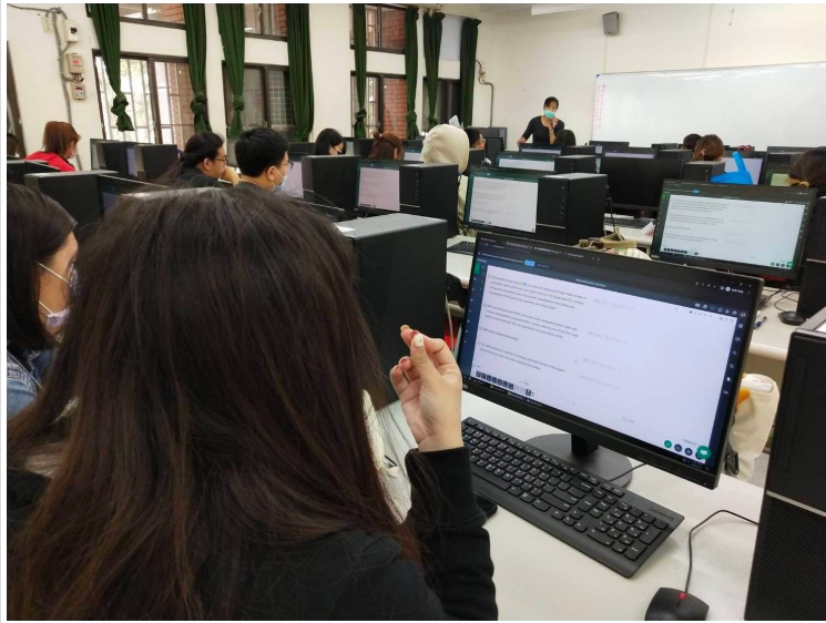
照片說明:當日講座