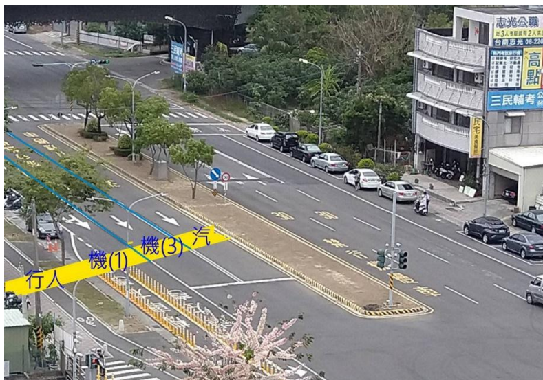
校門口：行人 1 + 機車 3 + 汽車 1