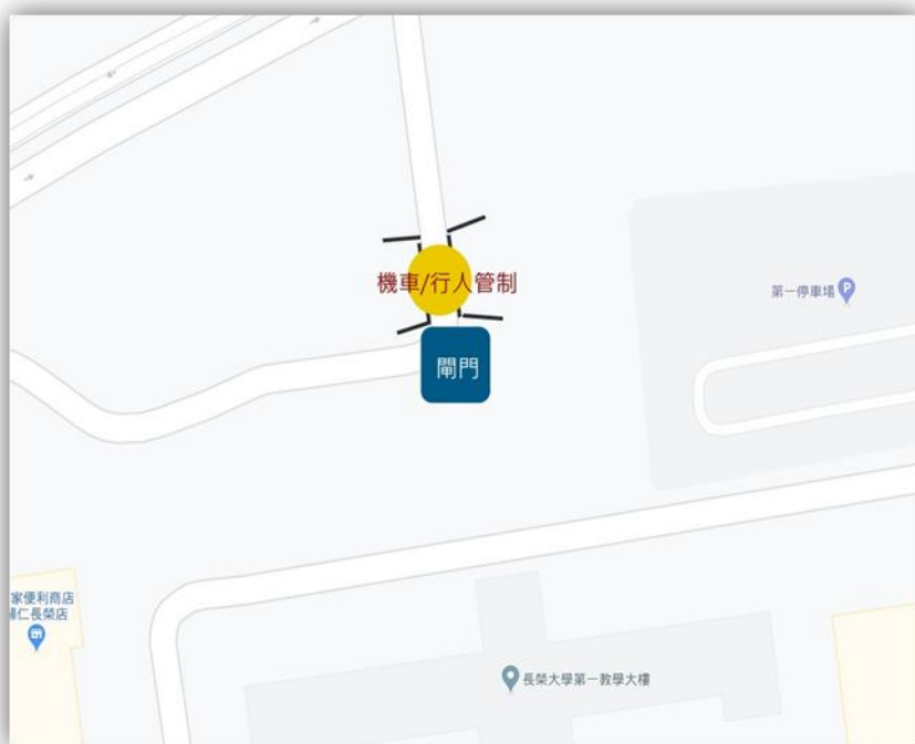
一教側門：行人 1 + 機車 1